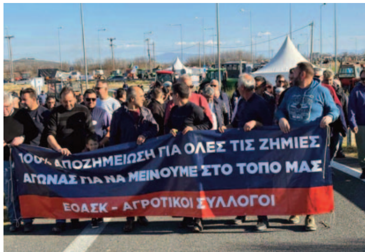
Από τις κινητοποιήσεις των αγροτών

Η απάντηση σε αυτή τη βάρβαρη πολιτική βρίσκεται στο «ιερό πεζοδρόμιο». Στο δρόμο που βαδίζει σήμερα το αγωνιστικό κομμάτι της Ελληνικής κοινωνίας. Εκεί πρέπει να συναντηθούν και οι απόδημοι της Ηπείρου.